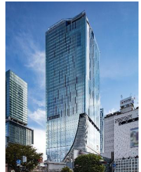
▲渋谷スクランブルスクエア外観

名称： 渋谷スクランブルスクエア／SHIBUYA SCRAMBLE SQUARE 事業主体： 東急(株)、東日本旅客鉄道(株)、東京地下鉄(株) 所在： 東京都渋谷区渋谷2丁目24番12号 用途： 事務所、店舗、展望施設、駐車場など 延床面積： 第Ⅰ期(東棟)約181,000㎡、第Ⅱ期(中央棟・西棟)約96,000㎡ 階数： 第Ⅰ期(東棟)地上47階 地下7階、 第Ⅱ期(中央棟)地上10階 地下2階、(西棟)地上13階 地下5階 高さ： 第Ⅰ期(東棟)229.7m、第Ⅱ期(中央棟)約61m、(西棟)約76m 設計者： 渋谷駅周辺整備計画共同企業体 ※(株)日建設計、(株)東急設計コンサルタント、(株)JR東日本建築設計、 メトロ開発(株) デザインアーキテクト：(株)日建設計、(株)隈研吾建築都市設計事務所、(有)SANAA 事務所 運営会社： 渋谷スクランブルスクエア(株) ※東急(株)、東日本旅客鉄道(株)、東京地下鉄(株)の3社共同出資 開業： 第Ⅰ期(東棟)2019年11月1日 第Ⅱ期(中央棟・西棟)2027年度(予定) URL： https://www.shibuya-scramble-square.com